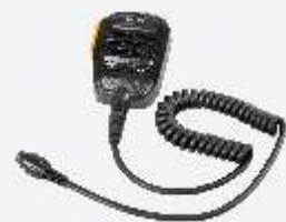
Micrófono altavoz remoto resistente al agua (IP67) SM18A1

Se recomienda la antena opcional de Hytera. *La utilización de la RD96X con antena en exteriores debe quedar al resguardo de las tormentas.