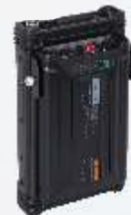
Sistema de administración eléctrica PV3001