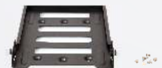
Soporte de instalación multifuncional BRK17