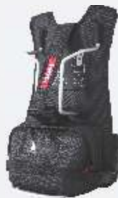
Mochila de nailon (solo para repetidora portátil) (negra) NCN010