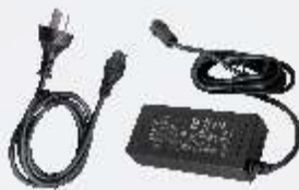
Adaptador de alimentación para repetidora portátil PS7502